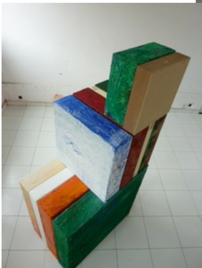
"en torno al espacio matèrico", installation picturale d'Álberto Reguera.