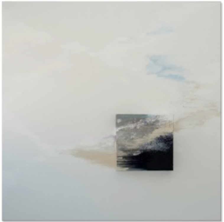
MENDELSSOHN'S SYMPHONIES ALBERTO REGUERA, 2008 200 X 200 X 21 cms.