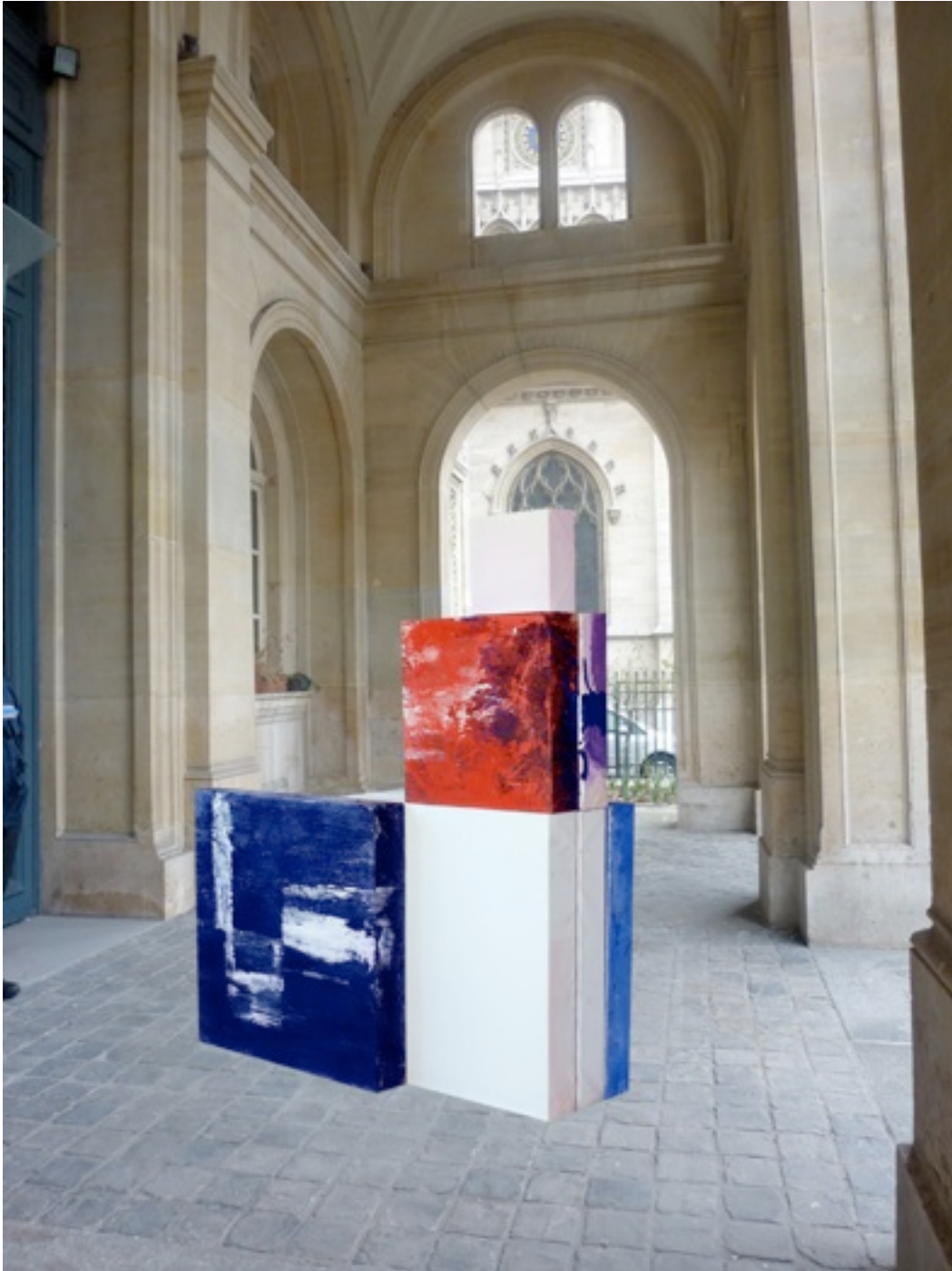
"estructuras pictóricas" Alberto Reguera. Installation picturale