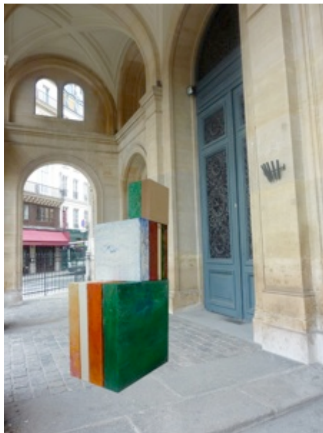
"en torno al espacio matèrico", installation picturale d'Álberto Reguera